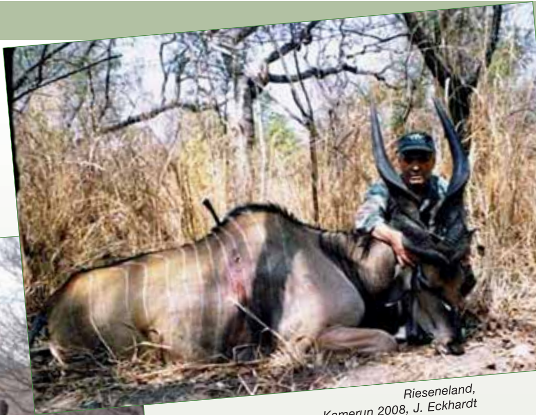
Rieseneland, Kamerun 2008, J. Eckhardt