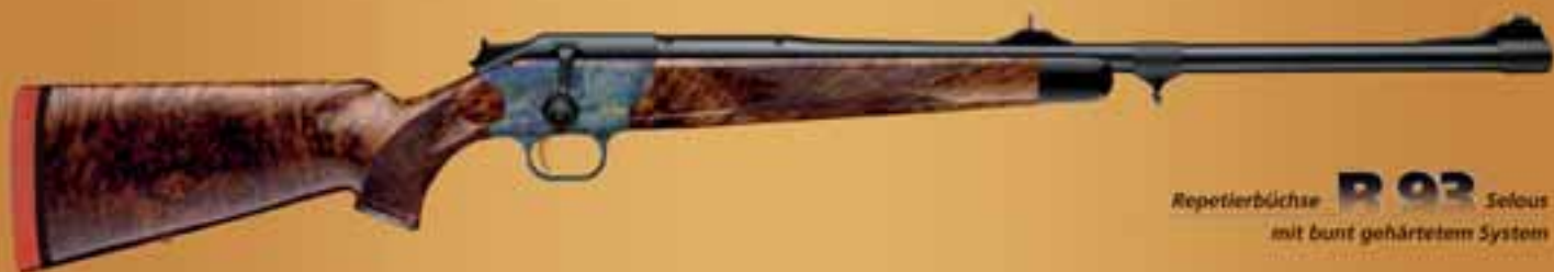
Repetierbüchse R 93 Selous mit bunt gehärtetem System

Kompromisslos auf die Großwildjagd zugeschnitten: Stahlsystemkasten, Safari-Lauf, Kickstopp im Hinterschaft und kompakte Bauart des R 93-Systems ergeben eine perfekte Masseverteilung und damit ein äußerst angenehmes Schießverhalten. Die einzigartige „Pointability“ der R 93 Selous ermöglicht den intuitiven Anschlag; lebenswichtig in entscheidenden Jagd-Situationen.