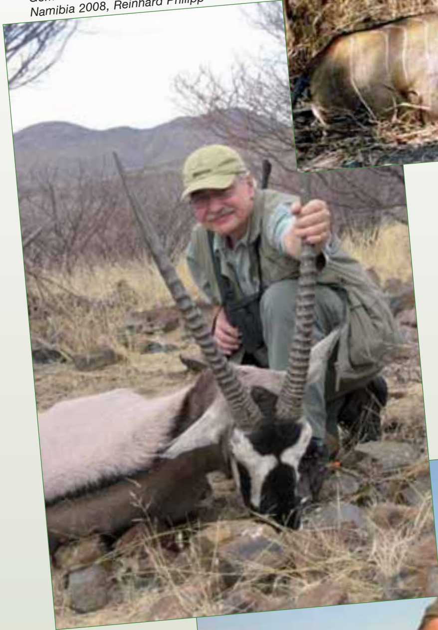
Gemsbock (Oryx), Namibia 2008, Reinhard Philipp