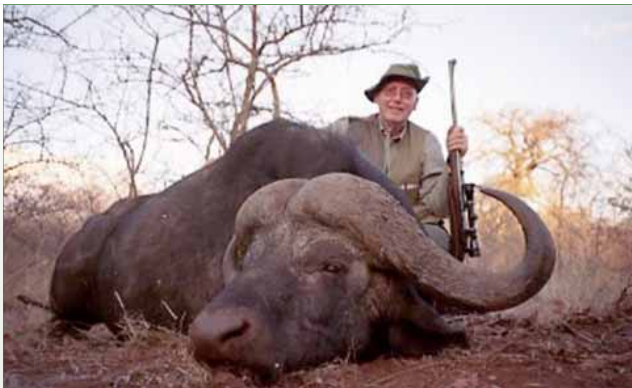
Büffel, Südafrika 2008, Siegfried Dreeke