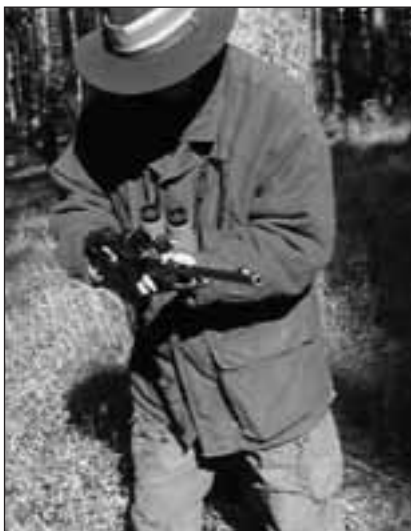
falsches Hantieren mit der Waffe bei Störung