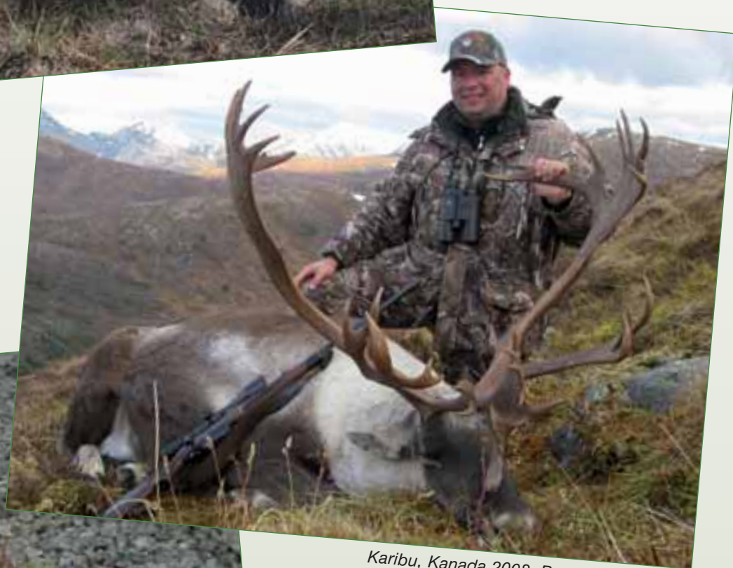
Karibu, Kanada 2008, Boris Kämmerling