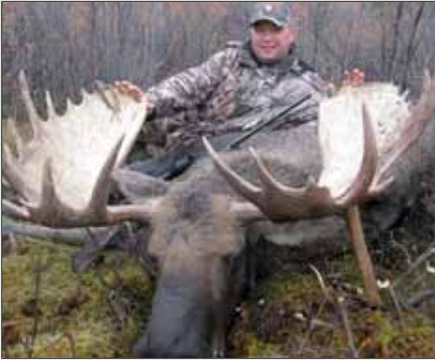
Elch, Kanada 2008, B. Kämmerling