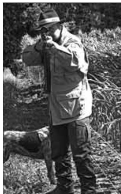
Durchziehen durch die Schützenkette