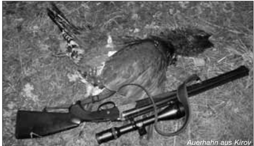
Auerhahn aus Kirov