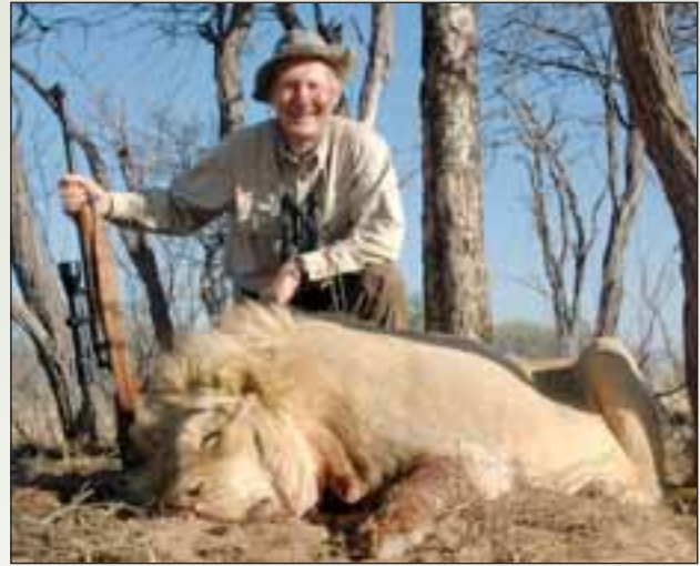
Löwe, Südafrika 2008, J. Ebermann