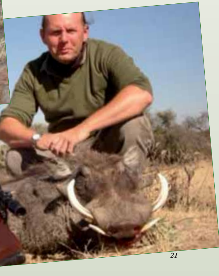
Warzenkeiler, Namibia 2008, Peter Späth