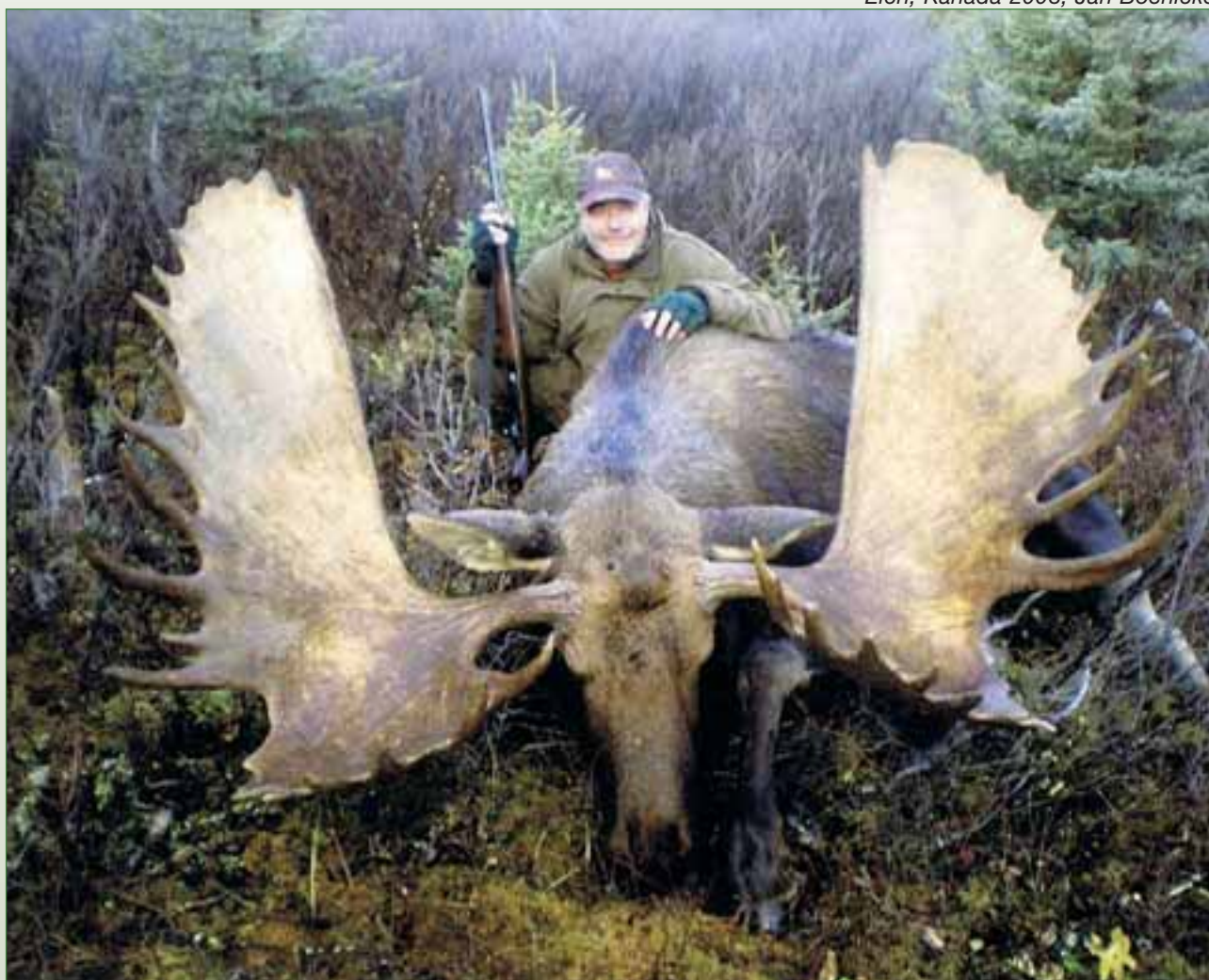
Elch, Kanada 2008, Jan Boenicke